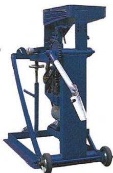
KSC002 アーム式 ストレートマシン ¥440,000(税込)

球種:ストレート 使用球:硬式・軟式 最高速度:140km/h 収容ボール数:80球 モーター:400W 1機 電源:AC100VorAC200V 寸法:630×1,100×1,300mm 重量:130kg