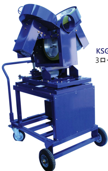
KSG001ST 3ローターピッチングマシン KSG