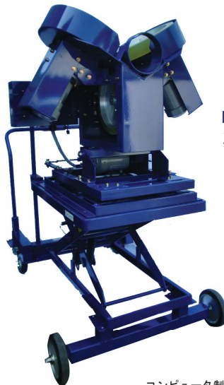
KSG001LC 3ローターピッチングマシン KSG リフターCP制御

KSG001ST 仕様 球種:全球種 使用球:硬式 球速:70~160km/h ローター径:315φ モーター:200W×2・400W×1 定格電圧:AC100V 周波数:50/60Hz