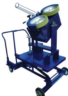
KSG011-L 2ローターピッチングマシン リフター仕様 ¥890,000+税

球種:全球種 使用球:硬式(KSG011H-ST) 軟式(KSG011M/J-ST) 最高速:硬式140km/h 軟式120km/h 投球高:ストレート950mm モーター:200W×2 ローター:315Φ 周波数:50/60Hz 定格電圧:AC100V 寸法:H1,160×W660×L770mm 重量:72kg