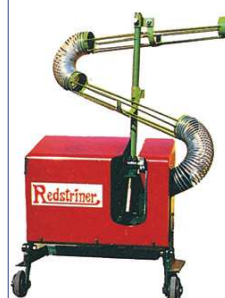
TE2 テニスマシン ¥190,000+税

使用球:硬式・軟式 収容ボール数:60球 消費電力:60W×1・25W×1 寸法:700×560×1,030mm 重量:65kg