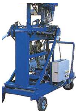
T-BSG ミラクルマシン ¥1,600,000+税