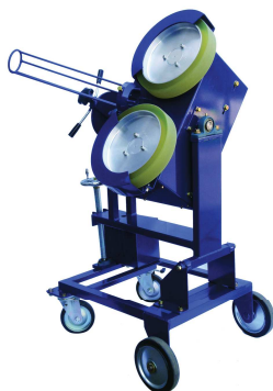
KSG011-ST 2ローター ピッチングマシン ¥660,000+税

球種:全球種 使用球:硬式(KSG011H-ST) 軟式(KSG011M/J-ST) 最高速:硬式140km/h 軟式120km/h 投球高:ストレート950mm モーター:200W×2 ローター:315Φ 周波数:50/60Hz 定格電圧:AC100V 寸法:H1,160×W660×L770mm 重量:72kg