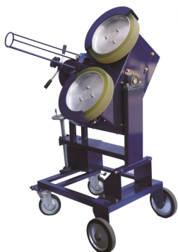
KSG011-ST 2ローター ピッチングマシン ¥660,000+税

球種:全球種 使用球:硬式(KSG011H-ST) 軟式(KSG011M/J-ST) 最高速度:硬式140km/h・軟式120km/h 投球高:ストレート950mm ローター径:315φ モーター:200W×2 定格電圧:AC100V 周波数:50/60Hz 寸法:H1,160×W660×L770mm 重量:72kg