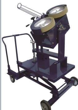
KSG011-L 2ローターピッチングマシン リフター仕様 ¥890,000+税

球種:全球種 使用球:硬式(KSG011H-ST) 軟式(KSG011M/J-ST) 最高速度:硬式140km/h・軟式120km/h 投球高:ストレート950mm ローター径:315φ モーター:200W×2 定格電圧:AC100V 周波数:50/60Hz 寸法:H1,160×W660×L770mm 重量:72kg