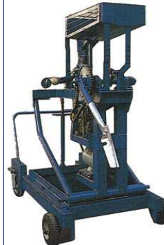
KSC011 アーム式ハイスピード ストレートマシン ¥850,000+税

球種:全球種 使用球:硬式(KSG011H-L) 軟式(KSG011M/J-L) 最高速度:硬式140km/h・軟式120km/h 投球高:ストレート1,100~1,500mm ローター径:315φ モーター:200W×2 定格電圧:AC100V 周波数:50/60Hz 寸法:H1,300~1,700×W900×L1,200mm 重量:145kg