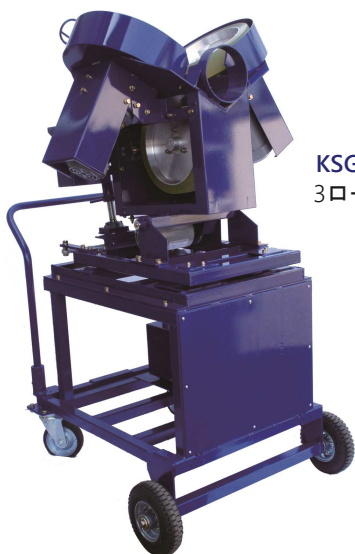
KSG001ST 3ローターピッチングマシン KSG