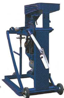
KSC002 アーム式 ストレートマシン ¥370,000+税

球種:ストレート 使用球:硬式・軟式 最高速度:140km/h 収容ボール数:80球 モーター:400W 1機 電源:AC100VorAC200V 寸法:630×1,100×1,300mm 重量:130kg