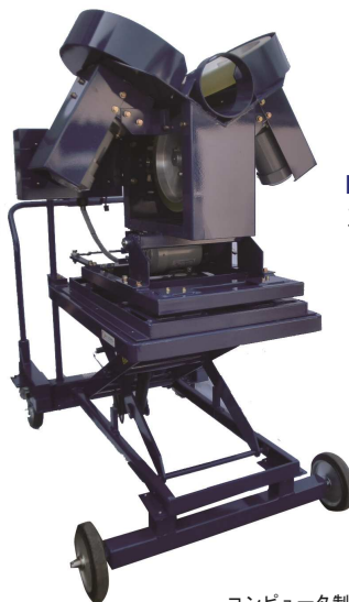
KSG001LC 3ローターピッチングマシン KSG リフターCP制御

KSG001ST 仕様 球種:全球種 使用球:硬式 球速:70~160km/h ローター径:315φ モーター:200W×2・400W×1 定格電圧:AC100V 周波数:50/60Hz