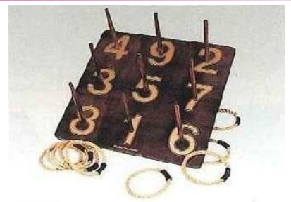
WST-10 輪投げセット ¥18,000+税 サイズ: 縦600×横600mm 素材: 積層合板 輪9本付き