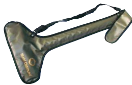
BS-50 スティックバッグ ¥2,600+税 カラー: モスグリーン 収納範囲: 75cm以内