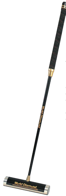
M-017 マレットスティック ¥14,000+税