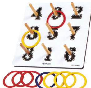
WST-30 ワナゲ公認セット ¥16,000+税 消音シート付 初心者でも初日から楽しめる面白さ 長く続けても飽きない奥深さ