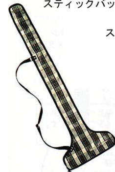
BS-12L スティックバッグ ¥3,000+税 カラー: ベージュ 収納範囲: 90cm以内