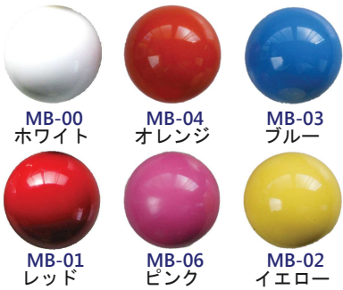
MB-00 ホワイト MB-04 オレンジ MB-03 ブルー MB-01 レッド MB-06 ピンク MB-02 イエロー