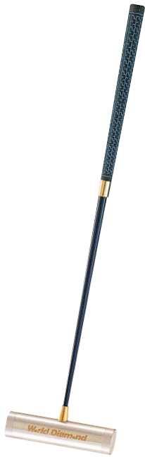
M-004 マレットスティック ¥9,800+税